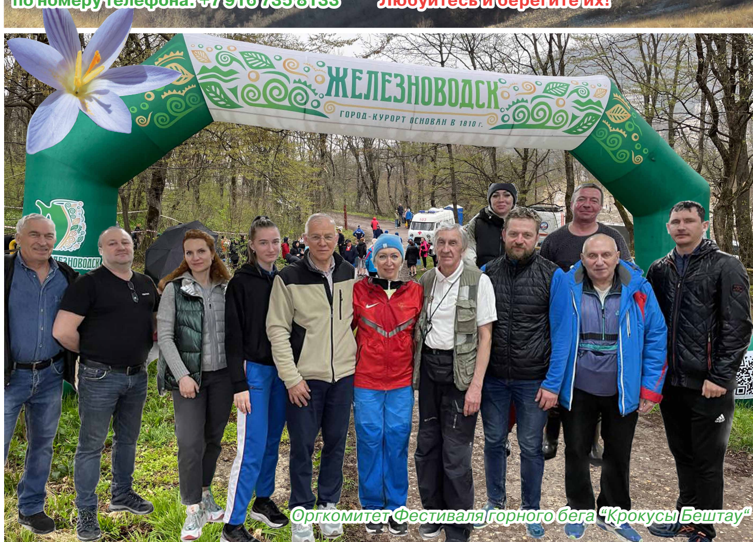
Оргкомитет Фестиваля горного бега "Крокусы Бештау"

Внимание! Не рвите, пожалуйста, крокусы ( Crocus reticulatus )! Любуйтесь и берегите их!