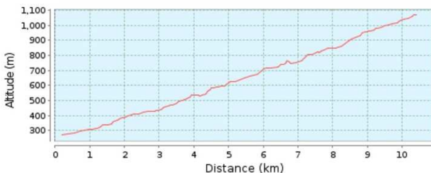
Профиль высоты (271 м в 1 071 м)